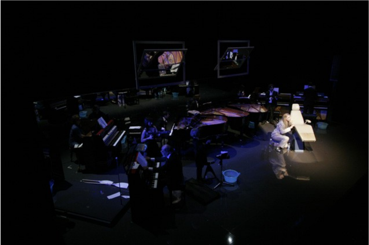
Immagine da “Il parlatore eterno”, opera per baritono e sette pianoforti (2006)

Il 2004 è l’anno in cui lavora alla colonna sonora del lungometraggio “ Tu devi essere il lupo ” di Vittorio Moroni , incisa dall’ orchestra AMIT di Roma , e allo spot sociale ONU “Unicri” .